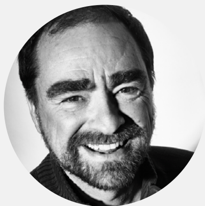
ARTISTE INVITÉ MICHEL RABAGLIATI